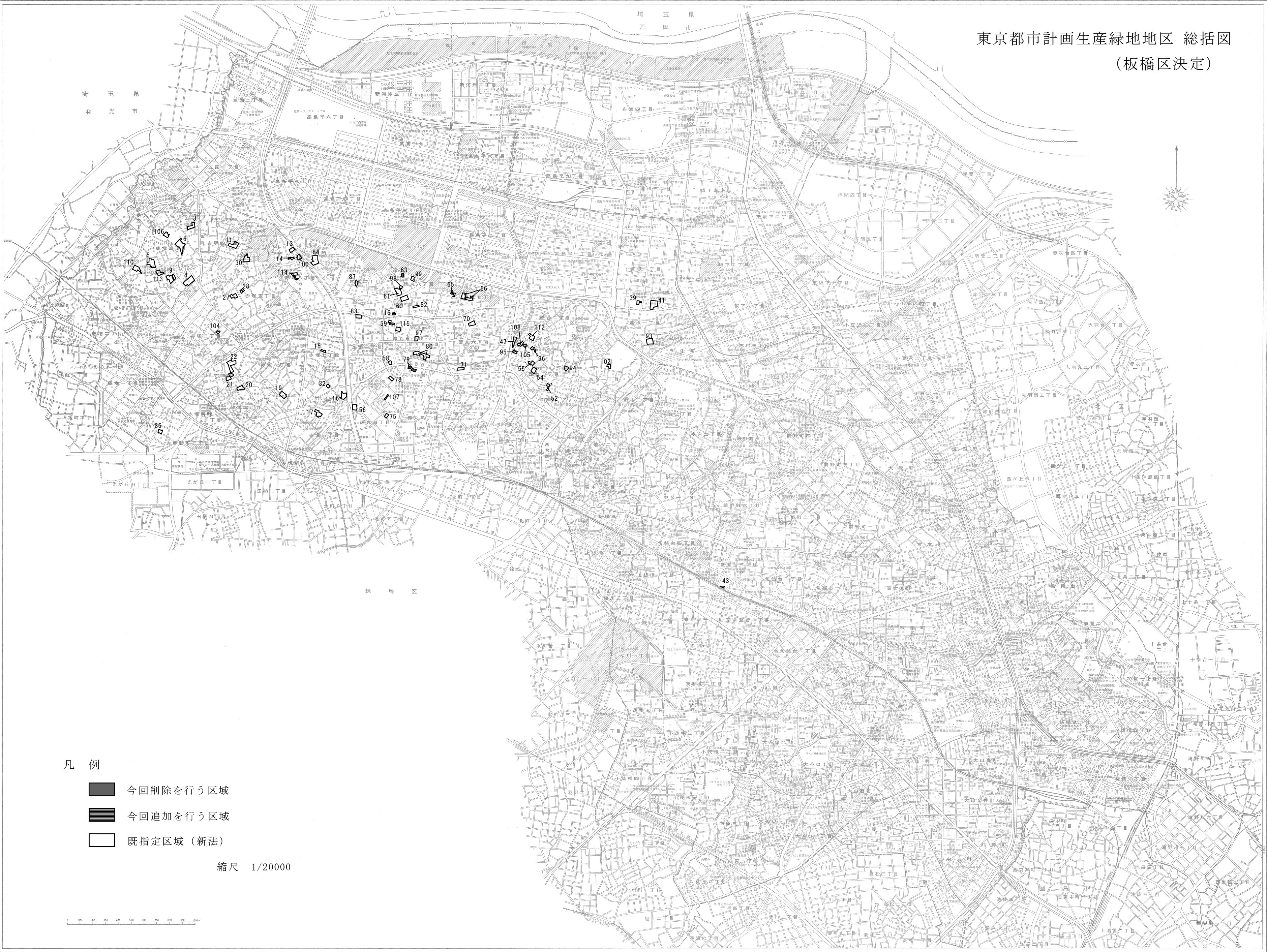
東京都市計画生産緑地地区 総括図 (板橋区決定)